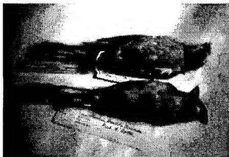
Foto 1. Macho y hembra de Gubernatrix cristata .

llar et al. 1992; De la Peña 1981; Meyer de Schauensee 1966; Pereyra 1938; Ridgely & Tudor 1989), sólo se alude a esta hibridación en Bascarán (1987) y Pazos (1995), quienes aclaran que se trata de ejemplares en estado silvestre. En cautividad, Gray (1958) cita casos de híbridos de Diucas y de Cardenales Amarillos. Cozzi (en Pazos 1995) informa que logró reproducir en cautiverio hembras de Gubernatrix cristata con machos de Diuca diuca en 1993 y con machos de Diuca specularifera en 1994. Cozzi (com. pers.) además intentó reproducir a los híbridos que obtuvo entre G. cristata x D. specularifera (F 2), cruzando un macho y una hembra (hermanos), pero al parecer los huevos habrían resultado infértiles, dado que no hubo eclosión en las tres puestas logradas (cada una de tres huevos, una 1995 y dos 1996). En 1995, el Sr. Néstor del Cueto intentó su cría en cautividad con un macho de Cardenal Amarillo y una hembra de Diu-