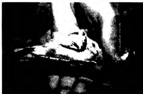
Foto 4. Híbrido entre Gubernatrix cristata x Diuca diuca , subadulto (vista ventral).