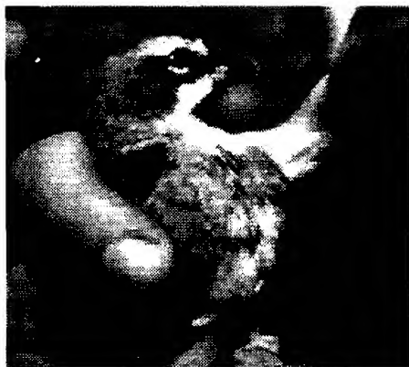
Foto 3. Híbrido entre Gubernatrix cristata x Diuca diuca , adulto (vista lateral).